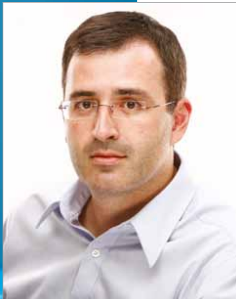
Сергей Маратович Гуриев, д.э.н., ректор

От имени коллектива Российской экономической школы я хотел бы поблагодарить выпускников Школы за участие в жизни РЭШ. Нам очень важны и Ваши предложения, и критика, и совместные проекты. В этом году Некоммерческое партнерство «Выпускники и друзья РЭШ» продолжило свою работу. Некоторые инициативы были настолько успешными, что они теперь повторяются из года