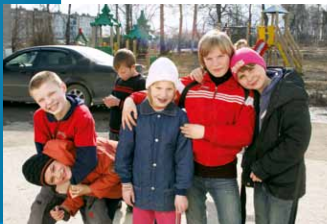
Наши детки в Обидимо

«А вы сегодня уедете, да?» - Слышу я рядом с собой... – «А еще приедете? А когда? Не уезжайте!». Это довольно странное ощущение, когда однажды понимаешь, что не так далеко есть место, где тебе всегда будут рады.